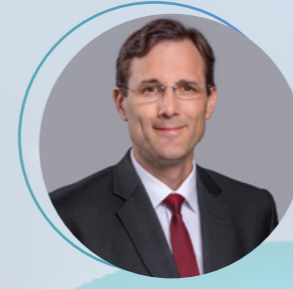
Dr. Tobias Meyer Vorstandsvorsitzender DHL